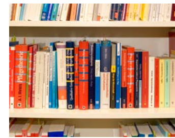
Pflege wissenschaftlich fundiert